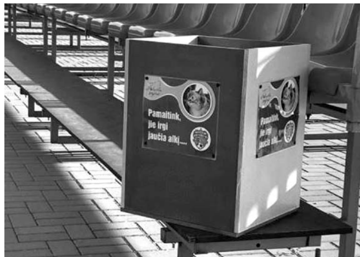
„Pamaitink, jie irgi jaučia alkį...“ - skelbia užrašas ant dėžės, į kurią futbolo mylėtojai galės atnešti maisto beglobiams rajono gyvūnams.

Futbolo klubas „Anykščiai“ žada jungtis ir prie kitų socialinių akcijų.