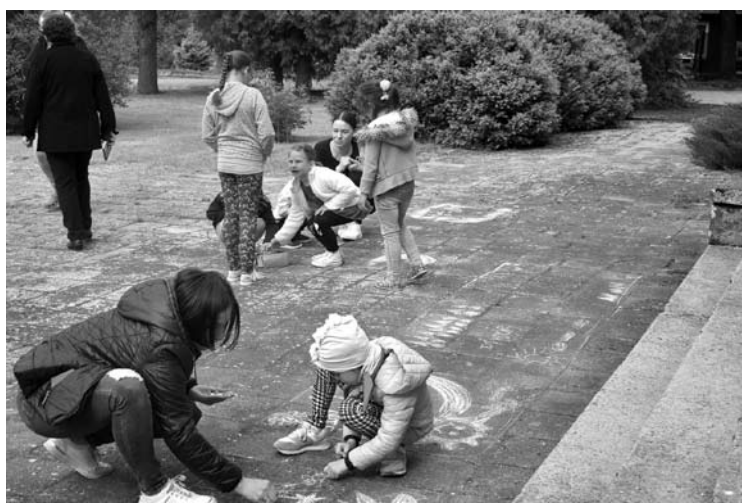
Nuotraukose akimirkos iš Vaikystės šventės Vaitkūnuose.