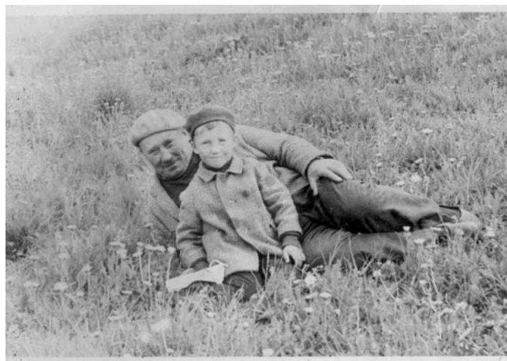
1973 metai. Beretė tuo metu buvo solidu.